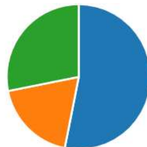
Gráfico 2: Indicação, pelo professor, se o aluno está preparado para o mundo do trabalho.

Na globalidade os professores da escola estão satisfeitos ou muito satisfeitos com o Ensino e Formação Profissional da Escola Secundária de Santa Maria Maior.