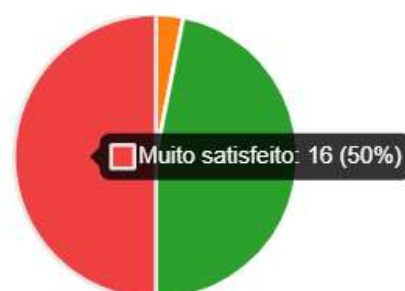
Gráfico 3: Grau de satisfação global do EFP da ESSMM.

Como sugestões de melhoria, os docentes propõem: